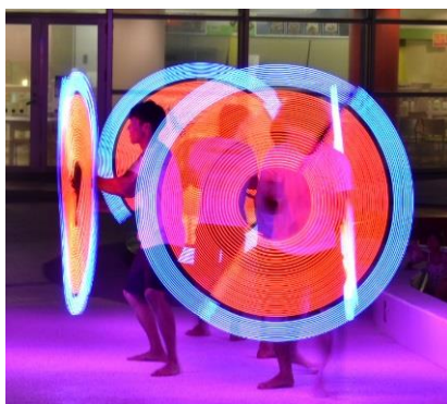
▲シバオラ「光」の特別ショー

今年7月にオープンした、高低差・長さ日本一のボディスライダー「ビッグアロハ」。オープンより、お客様から好評をいただいております。待ち時間をなるべく減らし、スムーズに乗るには夕方が狙い目。薄暗くなると、チューブ内も薄暗くなり、昼間よりもいっそう迫力が増します。