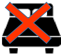
ベッドメイク・リネン交換